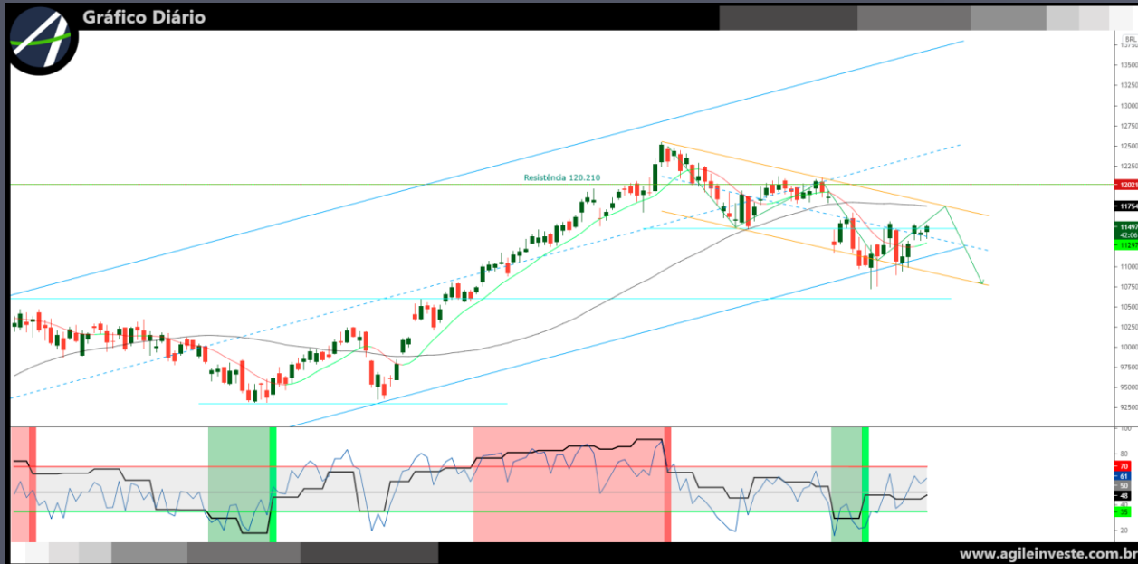
Gráfico do Ibovespa Futuro apresenta tendência de baixa no curto prazo, com sucessíveis topos e fundos descendentes, mas em busca de recuperação. Caso consiga romper a região dos 115.000 pontos, o próximo alvo será em 120.000 pontos. Média móvel de curto prazo inclinada pra cima, enquanto que a MM de 55 dias, mantém inclinação para baixo, deixando em dúvida quanto a extensão da alta. Viés indefinido para a semana.